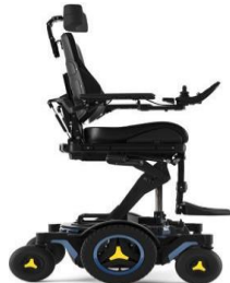
Elevación de asiento