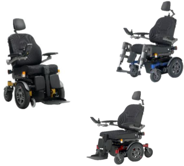
Esta imagen puede diferir de la configuración estándar.

Peso máximo del usuario 160 kg Anclaje de transporte ISO7176-19 Aprobado por la CE Sujeto a cambios sin previo aviso.