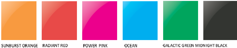
SUNBURST ORANGE RADIANT RED POWER PINK OCEAN GALACTIC GREEN MIDNIGHT BLACK