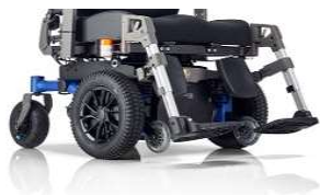
SANGO xxl FWD SEGO xxl