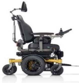
SANGO slimline MWD SEGO