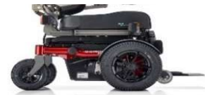
SANGO advanced FWD SEGO