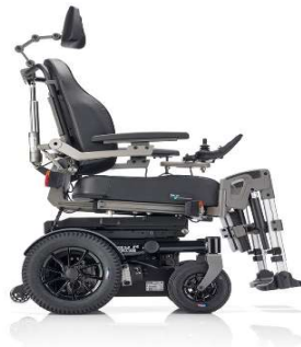
SANGO slimline RWD SEGO