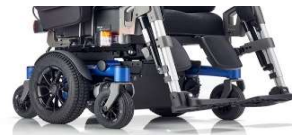
SANGO advanced MWD SEGO