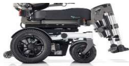
SANGO advanced RWD SEGO