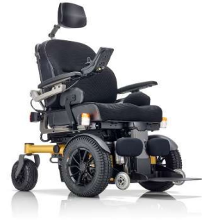
SANGO slimline FWD SEGO